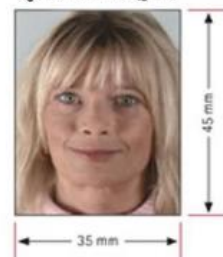
รูปถ่ายมาตรฐาน

- เจ้าของกิจการ หนังสือรับรองการจดทะเบียน(DBD)ที่มีชื่อของผู้เดินทางเป็นกรรมการหรือหุ้นส่วน อายุไม่เกิน 3 เดือน